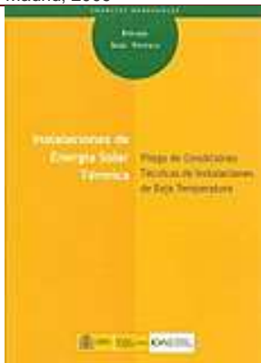
Instalaciones de energía solar térmica. Pliego de condiciones técnicas de instalaciones de baja temperatura. Madrid, 2009