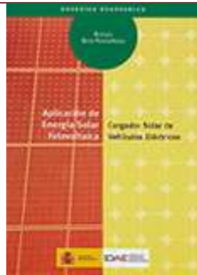
Aplicación de energía solar fotovoltaica. Cargador solar de vehículos eléctricos.