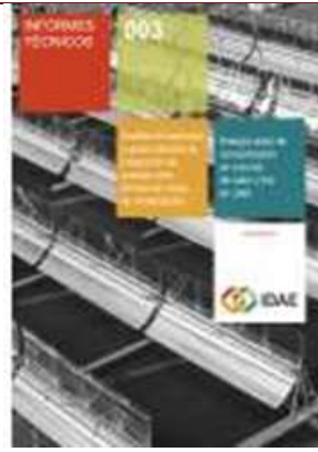
Análisis de potencial y oportunidades de integración de energía solar térmica en redes de climatización. Energía solar de concentración en una red de calor y frío en Jaén Madrid, 2015