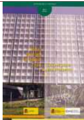
Solar energy in Spain 2007. Current state and prospects.