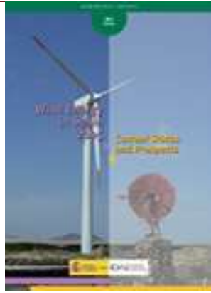
Wind energy in Spain 2005. Current status and prospects Madrid, 2006