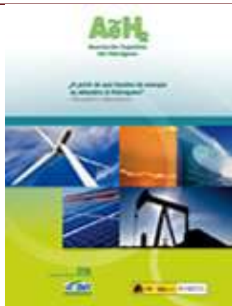
¿A partir de qué fuentes de energía se obtendrá el hidrógeno? Situación y alternativas Madrid, 2008