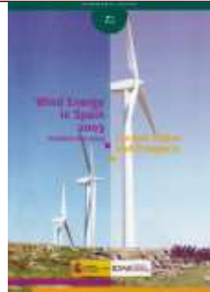
Wind energy in Spain 2003 (updated May 2004). Current status and prospects. Madrid, 2004