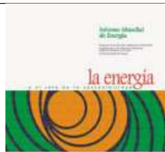
Informe mundial de energía: La energía y el reto de la sostenibilidad. Visión global Madrid, 2001