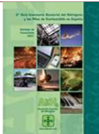
3ª Guía inventario sectorial del hidrógeno y las pilas de combustibles en España Madrid, 2008