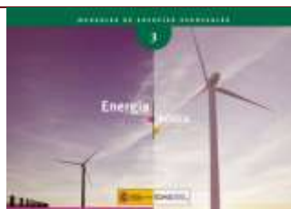
Energía eólica . Madrid, 2006