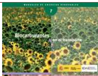
Biocarburantes en el transporte (2ª edición corregida) . Madrid, 2008