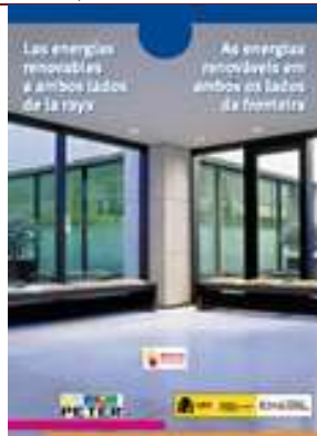
Las energías renovables a ambos lados de la raya. As energias renováveis em ambos os lados da fronteira.