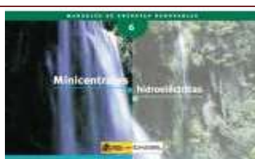
Minicentrales hidroeléctricas . Madrid, 2006