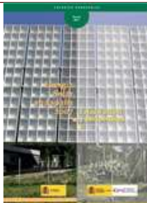
Energía solar en España 2007. Estado actual y perspectivas.