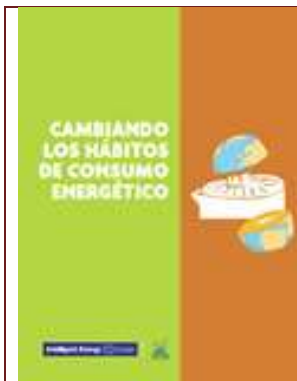
Cambiando los hábitos de consumo energético. Directrices para programas dirigidos al cambio de comportamiento .