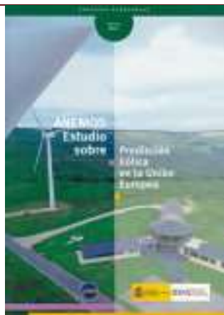
ANEMOS. Estudio sobre predicción eólica en la Unión Europea. Madrid, 2007