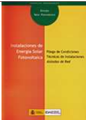
Instalaciones de energía solar fotovoltaica. Pliego de condiciones técnicas de instalaciones aisladas de red Madrid, 2009