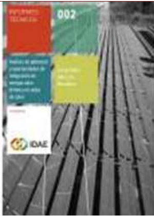
Análisis de potencial y oportunidades de integración de energía solar térmica en redes de calor. Las grandes redes de Barcelona Madrid, 2015