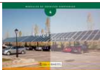
Energía solar térmica . Madrid, 2006