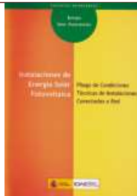
Instalaciones de energía solar fotovoltaica. Pliego de condiciones técnicas de instalaciones conectadas a red. Madrid, 2011