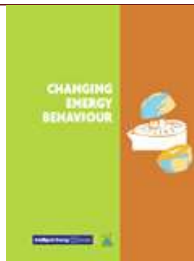
Changing Energy Behaviour. Guidelines for Behavioural Change Programmes.