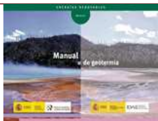
Manual de Geotermia (Reimpresión) Madrid, 2010