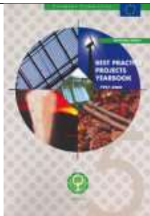
Renewable energy: best practice projects yearbook: 1997-2000 Madrid, 2002