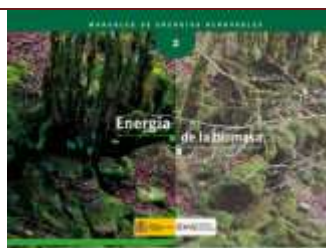
Energía de la biomasa . Madrid, 2007