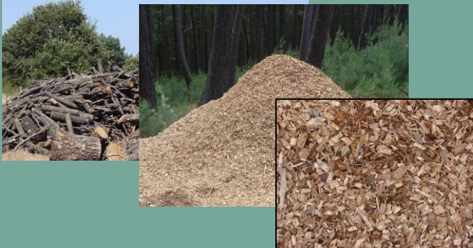
Astillas de residuos forestales o agrícolas